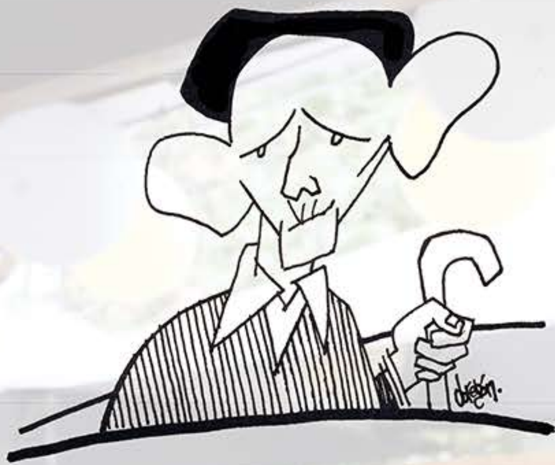
Fernando González Ilustración © Elkin Obregón