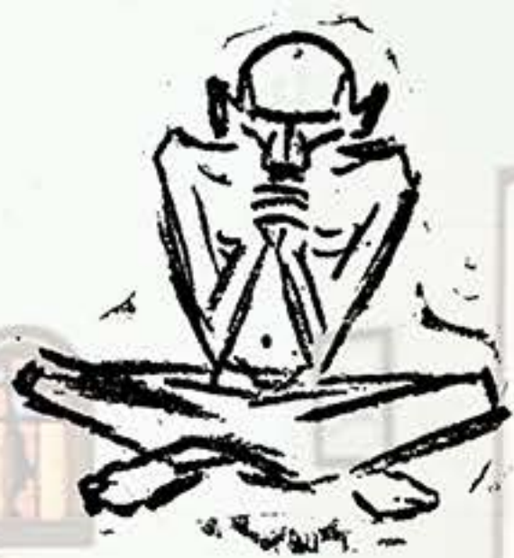
Ilustración de Alberto Arango Uribe para el último número de la revista «Antioquia» (1945).