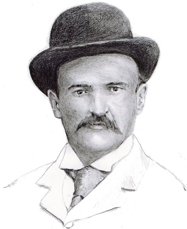
Ilustración © Daniel Gómez Henao